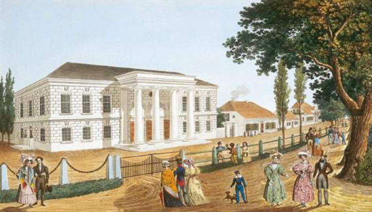
Friedrich Rosmäsler: „Das Theater in Putbus“