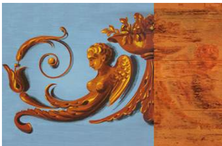
Motiv über der Proszeniumsloge, rechts Befund, links Rekonstruktion