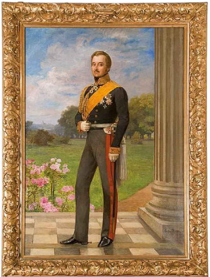
Wilhelm Malte zu Putbus, Ortsgründer und Bauherr des Fürstlichen Schauspielhauses