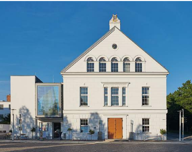
Das Theater vom Markt aus gesehen

Der Haupteingang verbirgt sich seit Eröffnung des Theaters an der zum Marktplatz gerichteten Schmalseite. Er ist nicht augenfällig als Eingang gestaltet, sondern mit einer Lyra auf dem Dach, einer Uhr im Giebel und ein paar Theatermasken lediglich markiert.