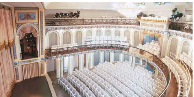
oben: Sicht von der Bühne in den Saal; unten: Blick in den Saal aus dem 2. Rang

Alles ist von nobler Zurückhaltung. Grau, Blau und Ockertöne bestimmen dezent das Halbrund des Zuschauerraums. Goldfarbenedes Blattwerk und Blumen ziehen die beiden Ränge entlang, Arkantusblätter bekrönen die Fürstenloge. Freistehende griechische Pfeiler tragen den ersten Rang, aus der Wand hervortretende Halbpfeiler den zurückgesetzten zweiten. Rundbögen schließen den Raum nach außen ab. Die Idee eines antiken Theaters klingt an, ohne Kopie zu werden. Als zeitgenössisches Element bilden feingliedrige schmiedeeiserne Gitter die Front der beiden Ränge – ein Unikat in der deutschen Theaterlandschaft. Und so setzt sich der Stil auch in den Foyers und in der Fassade konsequent fort. Nur die Raumdecke und die Bühnentechnik sind von heute. Die historische Bühnentechnik war vermutlich schon 1913 ausgetauscht worden; über die Deckengestaltung von 1826 ist nichts bekannt. Die heute durch die vorgezogene Bühne etwas gestauchten Proszeniumslogen waren ursprünglich tiefer hinunter reichende Orchesterlogen.