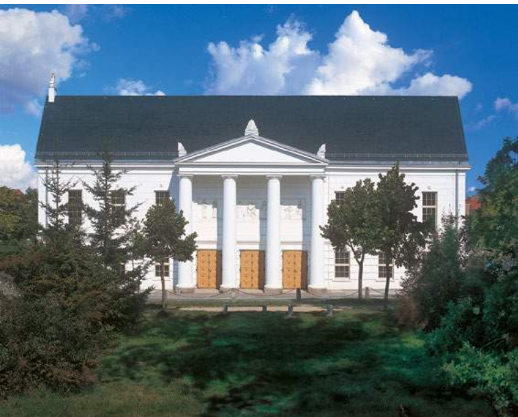
Das Theater vom Park aus gesehen

Im oberen Foyer entdeckten die Restauratoren auf zwei Wänden große, illusionistisch gemalte Architrave. Sie haben mit dem Foyer gar nichts zu tun, sondern sind anscheinend Versuche des Architekten darzustellen, wie eine mögliche Gestaltung der Eingangsfassade aussehen könnte. Vor Eröffnung des Theaters wurden sie dem Foyer entsprechend übermalt. Als Ergebnis der Restaurierung sind diese Zeugen der Entstehungsgeschichte des Theaters wieder freigelegt. Die Hauptfassade ist mit Säulenportikus und Dreiecksgiebel geschmückt, auf dessen drei Ecken steinerne, in ihrer Gestaltung dem Balkongitter im Inneren ähnliche Aufsätze thronen. Das Giebelfeld ist leer. Dafür befindet sich hinter den Säulen, auf Höhe der ersten Etage, ein Relief, das Apoll und neun recht locker herumstehende Musen zeigt. Wer hinter diesem imposanten Portikus den Eingang des Theaters vermutet, irrt. Die Fassade zur Straße hin ist nur als Blickfang für die Badegäste gedacht, die durch den Park oder die Häuser an der Allee entlang flanieren.