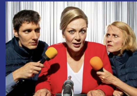
Steglitz, wir haben ein Problem! Wie Berlin zum Mars flog. DIE STACHELSCHWEINE 10. und 11. Oktober, 19.30 Uhr