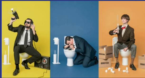
Im Hinterzimmer der Macht Eine schwindelige Bundestags-Revue KABARETT DISTEL BERLIN 13. und 14. September, 19.30 Uhr

Früher fiel in Krimis oft der herrliche Satz: „Der ist bei der Sitte“. Diese Zeiten sind vorbei. Dafür sind heute Hunderttausende unterwegs, um die Moral ihrer Mitmenschen zu bewachen und in den sozialen Medien zu kommentieren. Die schiere Anzahl ehrenamtlicher Bedenkenräger, zeigt: Selten war ein Strolch so notwendig wie heute!“ Man ahnt: Das kann ja heiter werden – so sehr, dass danach wieder getwittert wird.